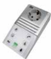
Funk-Blitzlampe mit Steckdose