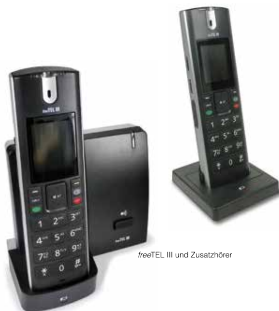
freeTEL III und Zusatzhörer