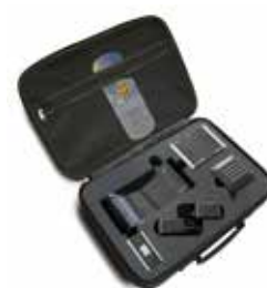
signalux Traveler Set