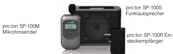
pro:ton SP-100M Mikrofonsender