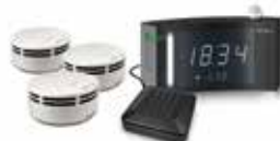
signolux Rauchmeldeset 3