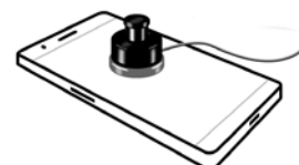
Sensor für Mobiltelefone