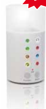
signolux Empfänger T