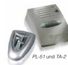
PL-51 und TA-2