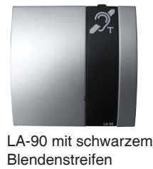
LA-90 mit schwarzem Blendenstreifen

Bemerkung : Im eingeschalteten Zustand leuchtet die Einschaltkontrollleuchte grün sowie die Kontrollleuchte auf der Vorderseite blau. Das Tischmikrofon und der Hörer sind somit betriebsbereit.