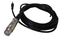
XLR-Buchsenkabel / 3,5 mm Klinke